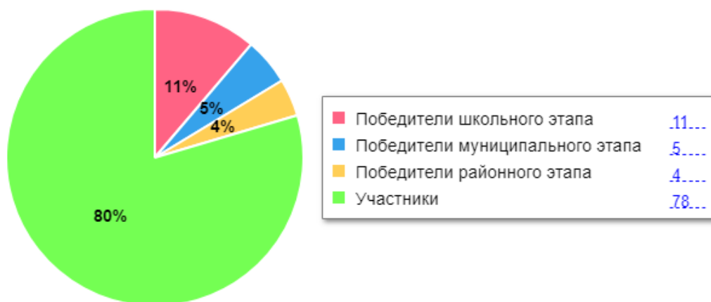
Диаграмма по результатам участия школьников во ВсОШ

В 2022 году был проанализирован объем участников конкурсных мероприятий разных уровней. Дистанционные формы работы с учащимися, создание условий для проявления их познавательной активности позволили принимать активное участие в дистанционных конкурсах регионального, всероссийского и международного уровней. Результат – положительная динамика участия в олимпиадах и конкурсах, привлечение к участию в интеллектуальных соревнованиях большего количества обучающихся Школы.